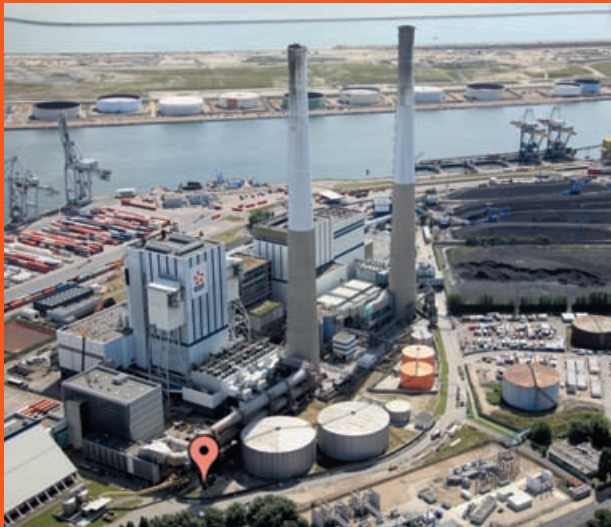
Centrale thermique du Havre