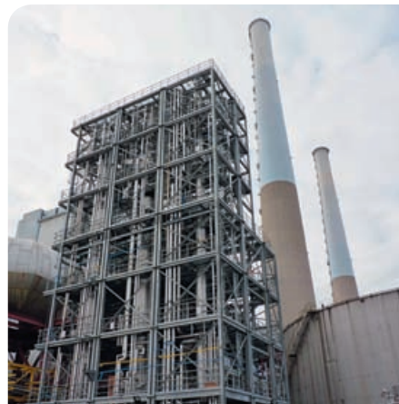
Pilote de captage de CO 2 , centrale du Havre

Plusieurs dizaines de pilotes industriels (échelle 1/1000 à 1/100) sont en exploitation. La prochaine étape est celle des démonstrateurs, des unités proches de la taille industrielle nécessaires pour valider les coûts industriels. L'Union européenne prévoit de contribuer au financement de deux ou trois démonstrateurs industriels de CSC. D'autres sont prévus aux Etats-Unis, en Chine, en Australie et au Moyen-Orient. Dans le contexte actuel de difficulté de financement liée à la crise, cette étape de démonstration industrielle prend du retard. En France, Total exploite à Lacq une chaudière au gaz naturel en oxy-combustion, d'une capacité de 10 tonnes de CO 2 captées par heure. Au Havre, EDF teste une technologie avancée sur les fumées d'une unité charbon.